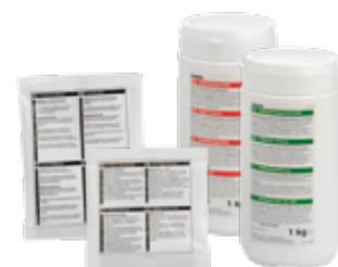
Entkalkungsmittel und Kaffeiansatzlösung